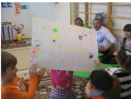
Рисуем проезжую часть.

Рост ребенка - серьезное препятствие и для своевременного обнаружения его водителем на дороге. Из-за стоящего транспортного средства, стоящей группы пешеходов, сугробов снега он не виден водителю, который находится на дороге.