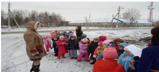
«На перекрестке дорог с.п.Сергино»